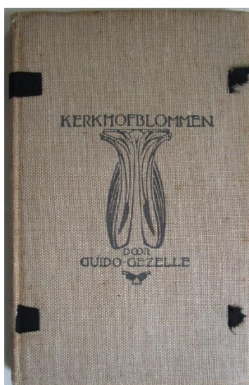
59 – Gezelle – De Praetere