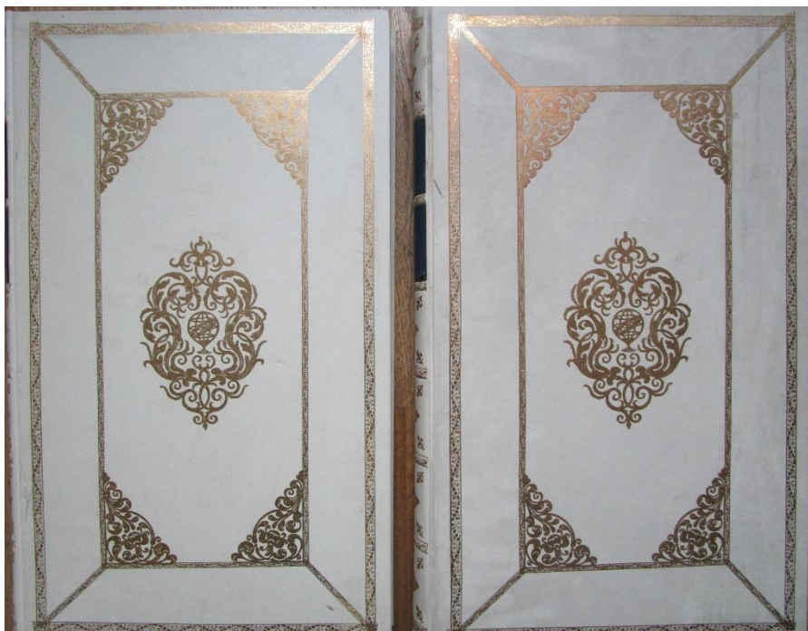
6 – Blaeu – Facsimile-uitgave