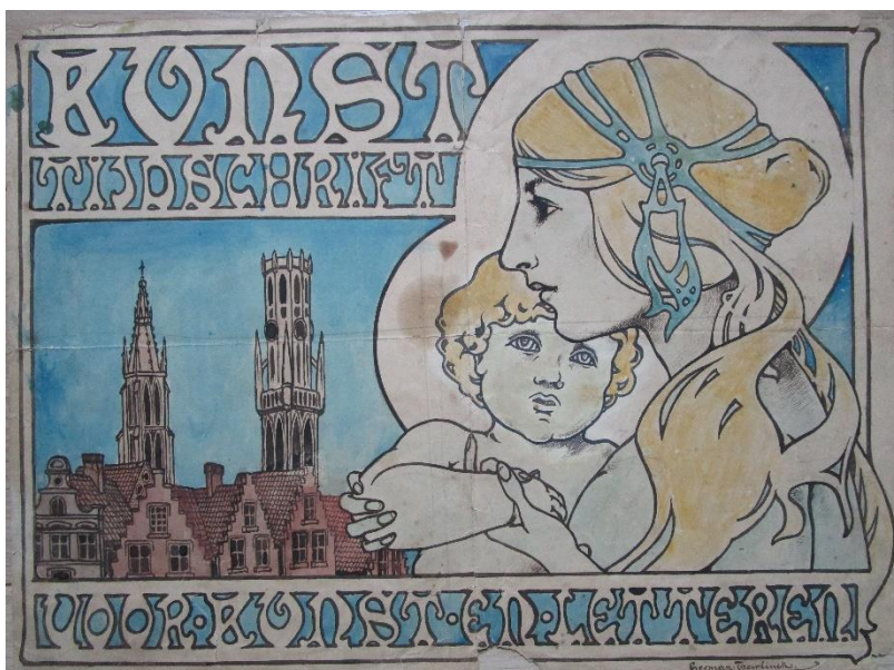
77 – Teirlinck – Ontwerp tijdschrift