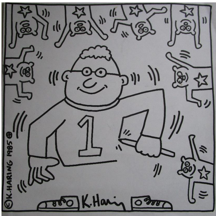
3 – Keith Haring – “Coloring book”