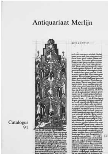
7 Catalogus 91: Rare and valuable books (1979). De gedrukte boeken zijn per eeuw gerangschikt (Collectie Secundus, Terhole).

J. van Egmont in 1752 (verkoopprijs fl. 12,50). Hiervan heb ik alleen een exemplaar gezien bij de jongste dochter van de antiquaar; elders is het boek onvindbaar. Het is duidelijk dat Van den Berg er naar streefde een goede combinatie te maken van nieuwe uitgaven met aan zijn specialisaties gelieerde tentoonstellingen en catalogi met bijzonder aanbod.