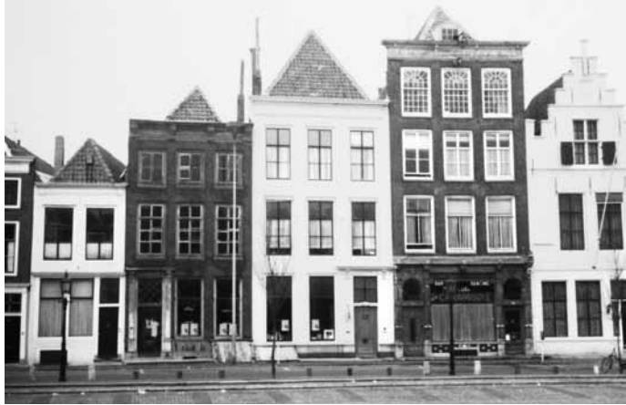
5 Antiquariaat Merlijn en het veilinghuis te Middelburg, Damplein 21 en 23 (Collectie Leontien van den Berg, Apeldoorn).

Zeeland exposeerden. Daarbij verscheen in een beperkte oplage een catalogus; de luxe-exemplaren met een gesigioneerde ets.