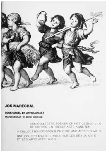
8 Catalogus Een collectie boeken op het gebied van de schone en toegepaste kunsten . Brugge, J. Marechal, 1983 (Collectie Secundus, Terhole).

Boekhandel en Antiquariaat Jos Marechal in Brugge was gaan werken, een tweetal catalogi met oude en bijzondere uitgaven. Catalogus 1 bevatte ‘een keuze zeldzame en waardevolle boeken’, en catalogus 2 ‘een collectie boeken op het gebied van de schone en toegepaste kunsten’ (afb. 8). De samenwerking heeft niet lang geduurd, maar toch langer dan een jaar. Van den Berghs karakter was niet geschikt om in de rol van ondergeschikte te werken; daarvoor was hij te eigenzinnig en te creatief. Bovendien kreeg de drank hem steeds sterker in zijn greep. Na enkele verhuizingen kwam hij in het Vlaamse Middelburg te wonen. In deze periode kwam hij in relatief rustig vaarwater terecht: hij kreeg een nieuwe relatie en werkte niet meer. Nu vond hij de inspiratie en de tijd om in eigen beheer een viertal bundeltjes in klein formaat met zeer korte gedichtjes te publiceren, alle