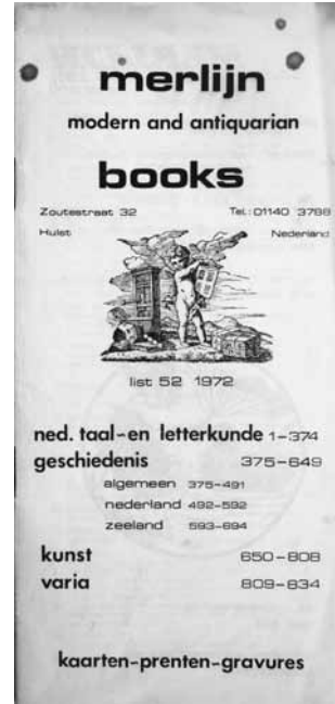
2 De vroegst bekende catalogus van Merlijn, nr. 52 (1972).