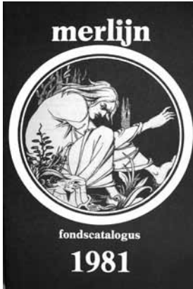
13 Fondscatalogus Antiquariaat Merlijn (1981) (Collectie Secundus, Terhole).

rijkers (1515-1561) , deel 2 in de reeks 'Leuvense studiën en tekstuitgaven' (verkoopprijs fl. 39). Voorts aankondiging van de voorjaarsverkooptentoonstelling (21 maart t/m 25 april 1981) in Kunsthandel en Galerie De Witte Swaen te Middelburg met o.a. etsen van Marius Bauer.