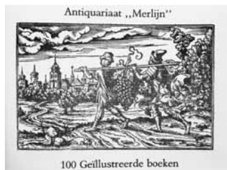
12 Catalogus 100 Geïllustreerde boeken (1980). Verschenen t.g.v. de opening van het pand ‘De Gouden Druyff-tack’, Damplein 21, Middelburg (Collectie Secundus, Terhole).

[102] [***] Veiling van oude en zeldzame boeken . 1981. Catalogus van de veiling op zaterdag 28 maart 1981. Ca. 21 × 14,5 cm; [60] pp. In de catalogus zijn op een los vel ook de nummers opgenomen die op zaterdag 4 april aan bod zouden komen. Bevat ook een inschrijfformulier voor de facsimile-uitgave op geveergeerd papier en gebonden in een imitatie-perkamenten band van Der sotten schip van Sebastiaan Brant, en een aankondiging van E. van Autenboer, Het Brabants landjuweel der rede-