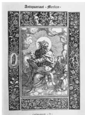
10 Catalogus 72: Old and valuable books (1976) (Collectie Secundus, Terhole).

OPKOMST EN NEERGANG VAN ANTIQUARIAAT MERLIJN