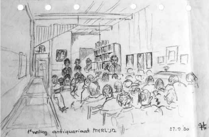
6 T ekening van de eerste veiling bij Merlijn op 27 september 1980 door Huib Zuidervaart sr. (Collectie Leontien van den Berg, Apeldoorn).

nering (verkoopprijs fl. 22,50) en van een eindejaars-tentoonstelling met ‘Moderne Vlaamse grafiek 1969-1970’.